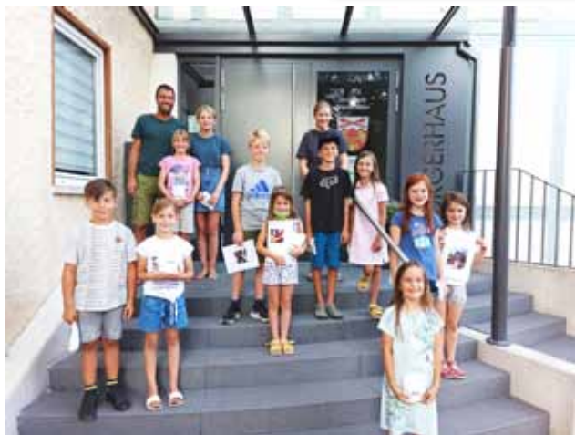
Siegerehrung Dorfralley Niederlauer