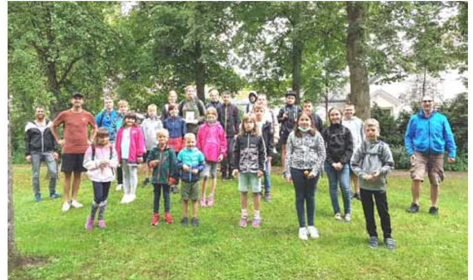
Minigolf mit der Gemeinde