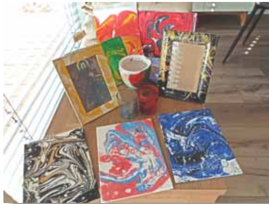
Marmorieren im Häusle Niederlauer

Ein großer Dank gilt allen Veranstaltern, Vereinen und Privatpersonen, die am Ferienpaß mitgewirkt und ein tolles, abwechslungsreiches Programm auf die Beine gestellt haben! Auch den Vor-Ort-Koordinatoren der beteiligten Gemeinden Burglauer, Hohenroth, Hollstadt, Niederlauer mit Unter-/ und Oberebersbach, Rödelmaier, Salz, Schönau a.d. Brend, Strahlungen, Unsleben und Wollbach sei an dieser Stelle herzlich gedankt.