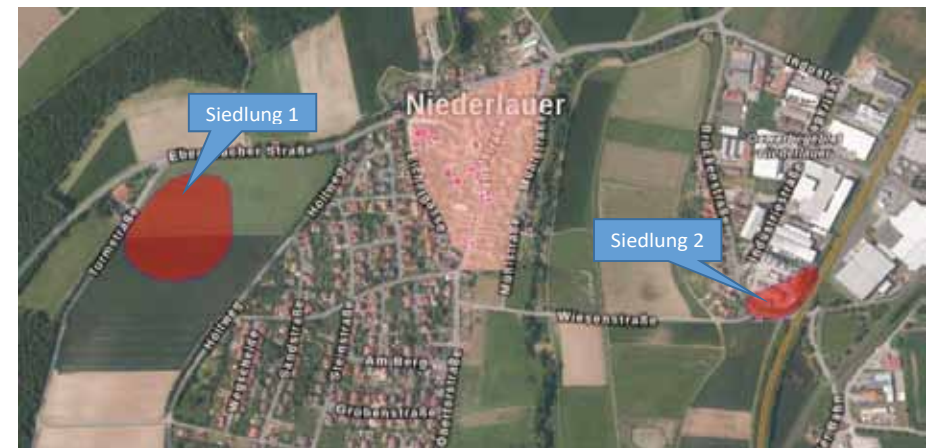
Bild 3: Siedlungen um Niederlauer mit vorgeschichtlicher Zeitstellung

Im Übrigen muss der heutige Ortsbereich nicht der ursprüngliche gewesen sein. Es gibt Hinweise darauf, dass schon in prähistorischer Zeit Menschen im Bereich der heutigen Brückenstraße (etwa in Höhe des RST-Geländes) siedelten. Gleiches gilt für den Bereich zwischen Höllweg und Turmstraße (entlang des Sportplatzes). Beide Gebiete sind für Niederlauer als Bodendenkmäler vom Bayerischen Landesamt für Denkmalpflege als „Siedlungen vorgeschichtlicher Zeitstellung“ aus-