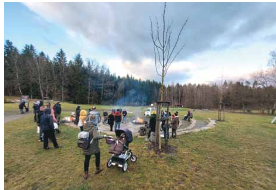
1. Infoveranstaltung Waldkindergarten am 19.12.2021.

Alle weiteren Informationen zu Kosten, Infoveranstaltung und den Aufnahmeantrag finden Sie unter www.nes-allianz.de