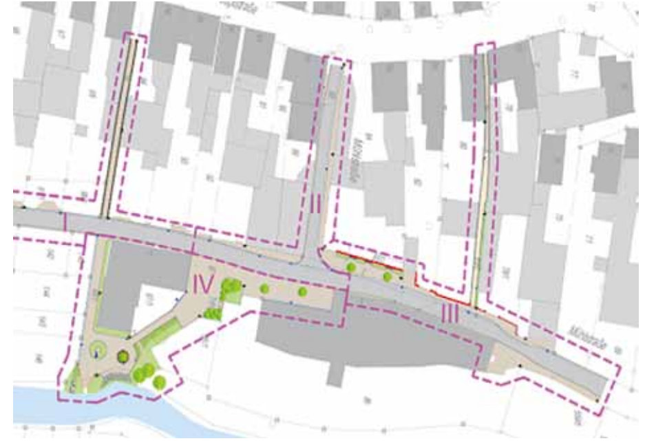
Abbildung 1: Auszug Bauphasenplan

Fragen rund um die Maßnahme beantwortet das Sachgebiet Tiefbau in der Verwaltungsgemeinschaft Bad Neustadt. Tel. 09771 6160-23